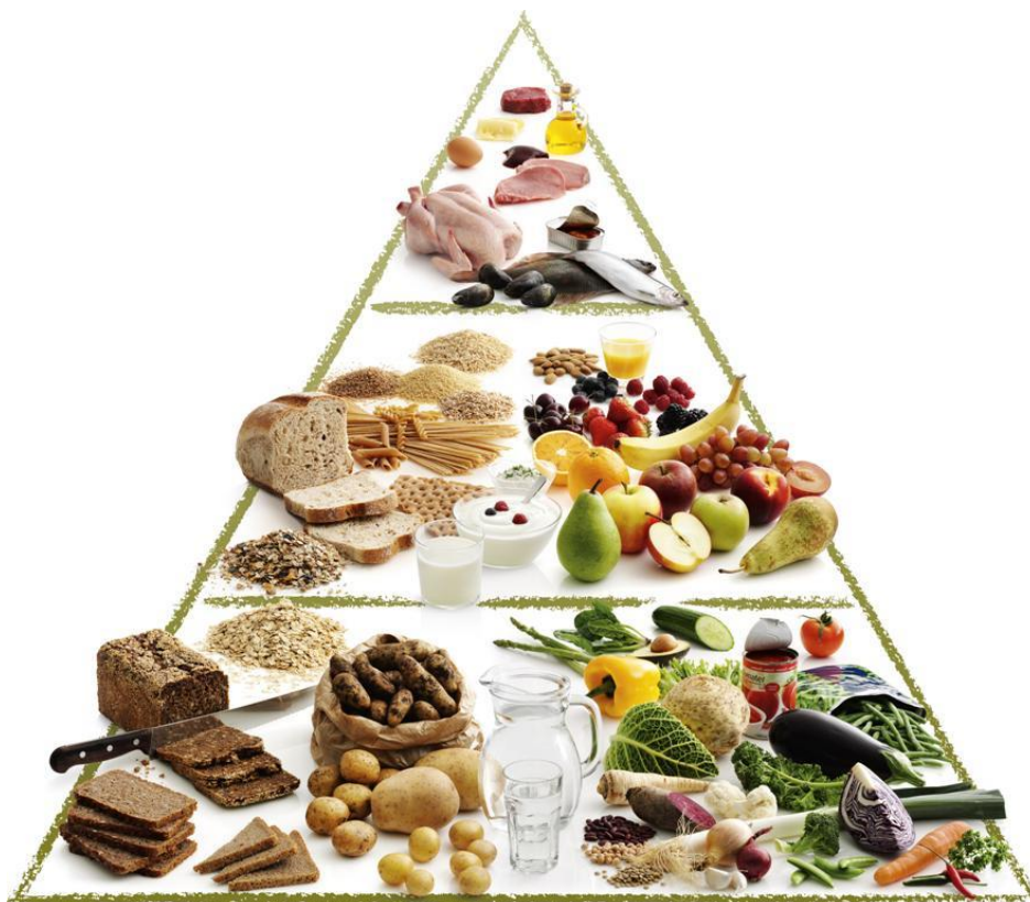
Figur 2: Madpyramiden

I 2011 udviklede FDB en ny udgave af den velkendte madpyramide. FDB's nye madpyramide er vist i Figur 2. Heraf fremgår det, at man ideelt set bør spise mest af groft brød — særligt rugbrød — og grøntsager. Ser man på andelen af disse indsamlede fødevarer hos FødevarerBanken, udgør grøntsager samlet set godt 12 pct 1 . af den totale indsamlede mængde fødevarer. Den nye madpyramides midterste lag udgøres af mejeriprodukter, frugt og lyst brød. Disse typer af fødevarer udgør i 2019 sammenlagt 42 pct 1 . af den totale indsamlede mængde fødevarer hos FødevarerBanken. Man kan indvende, at proportionerne burde være omvendte; således at det nederste lag udgjorde en større andel end det midterste lag. Det er imidlertid ikke muligt at kontrollere, hvilke typer af fødevarer, der dagligt bliver doneret. Men at madpyramidens nederste og midterste lag samlet udgør ca. 54 pct 1 . af de indsamlede fødevarer, er i sig selv en vigtig faktor i forhold til FødevarerBankens bekæmpelse af madfattigdom i Danmark. Andelen af den indsamlede mad, der hører til madpyramidens øverste lag – der hovedsageligt omfatter kød – udgør i 2019 godt 5 pct. Det betyder, at ca. 59 pct 1 . af den indsamlede mad indgår i ét af madpyramidens tre lag.